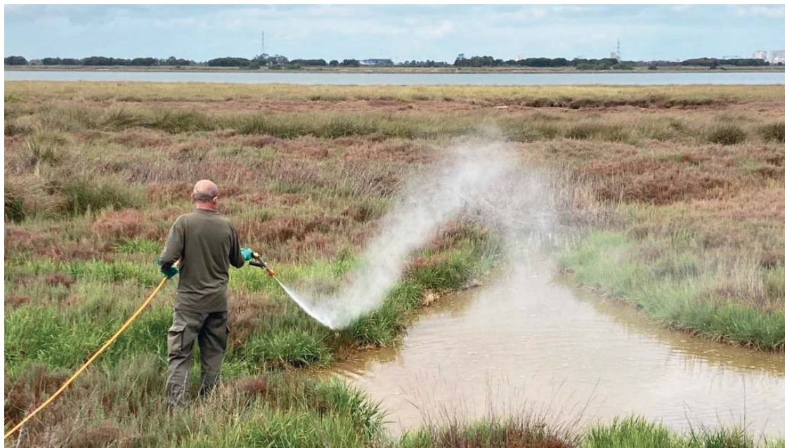
Tratamiento contra mosquitos en una zona de marismas de la Costa de Huelva, y en un área urbana (abajo).