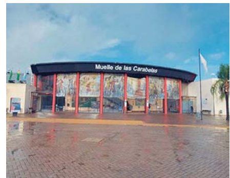
Muelle de las Carabelas de La Rábida, en Palos de la Frontera.

Las obras tienen dos objetivos básicos: la adecuación de los paramentos de la sala y la actualización del sistema audiovisual.