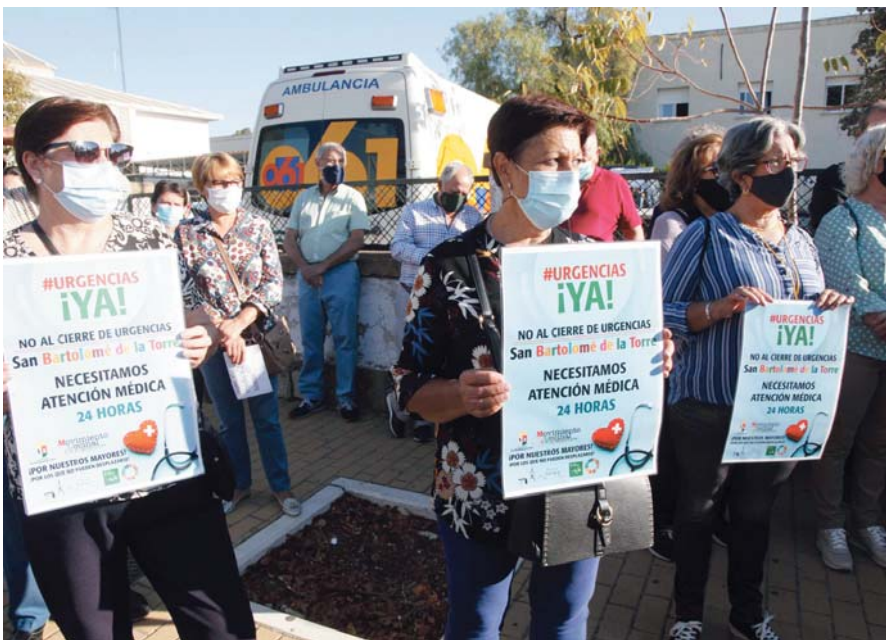
Protesta vecinal por el cierre de las Urgencias del Centro de Salud de San Bartolomé de la Torre.

El senador ha aseverado también que "se negaron a rectificar" porque "es obvio que tienen en mente la venta de la Atención Primaria" y "no van a rectificar porque es un dinero sustancial para las