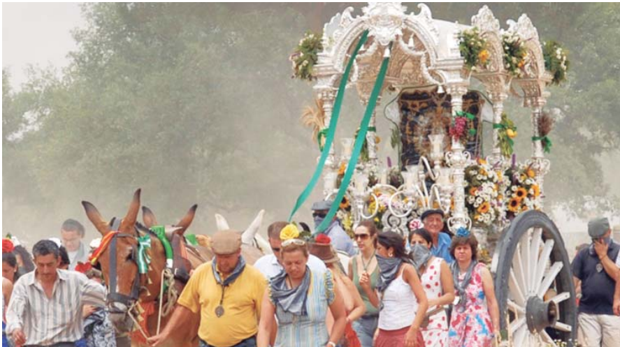
Las hermandades de Ayamonte e Isla Cristina abrieron el camino de Huelva este lunes 22 de mayo, una semana después de la reunión de coordinación del Plan Romero 2023.

CELEBRACIÓN La multitudinaria romería espera movilizar a un millón de peregrinos