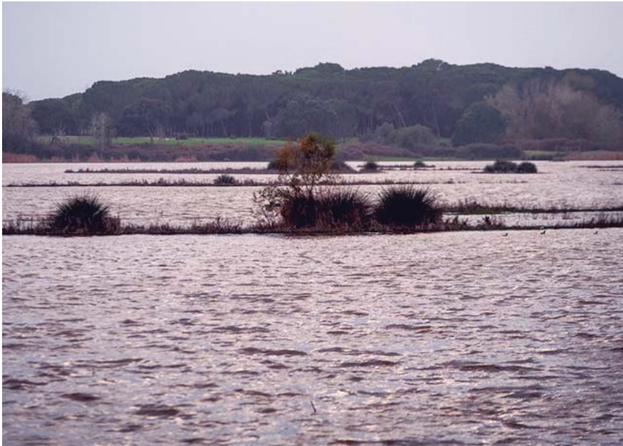
Aprobado un nuevo trasvase de tres hectómetros cúbicos a Doñana.

En concreto, el Gobierno ha acordado que el Estado asumirá las obras para acometer un trasvase en Doñana y abastecer a Matalascañas con la sustitución de los bombeos de agua subterránea que abastecen a la conurbación