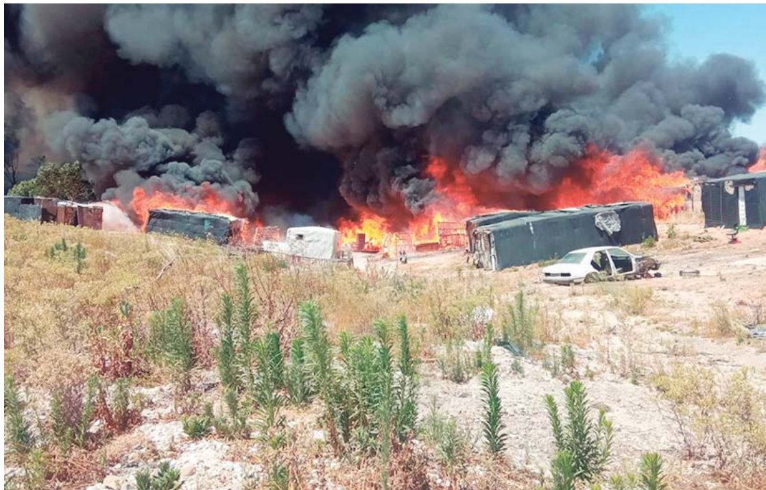
Imagen del incendio del asentamiento de Palos de la Frontera.

SINIESTRO Catorce efectivos y 10 vehículos del Consorcio de Bomberos sofocan el fuego