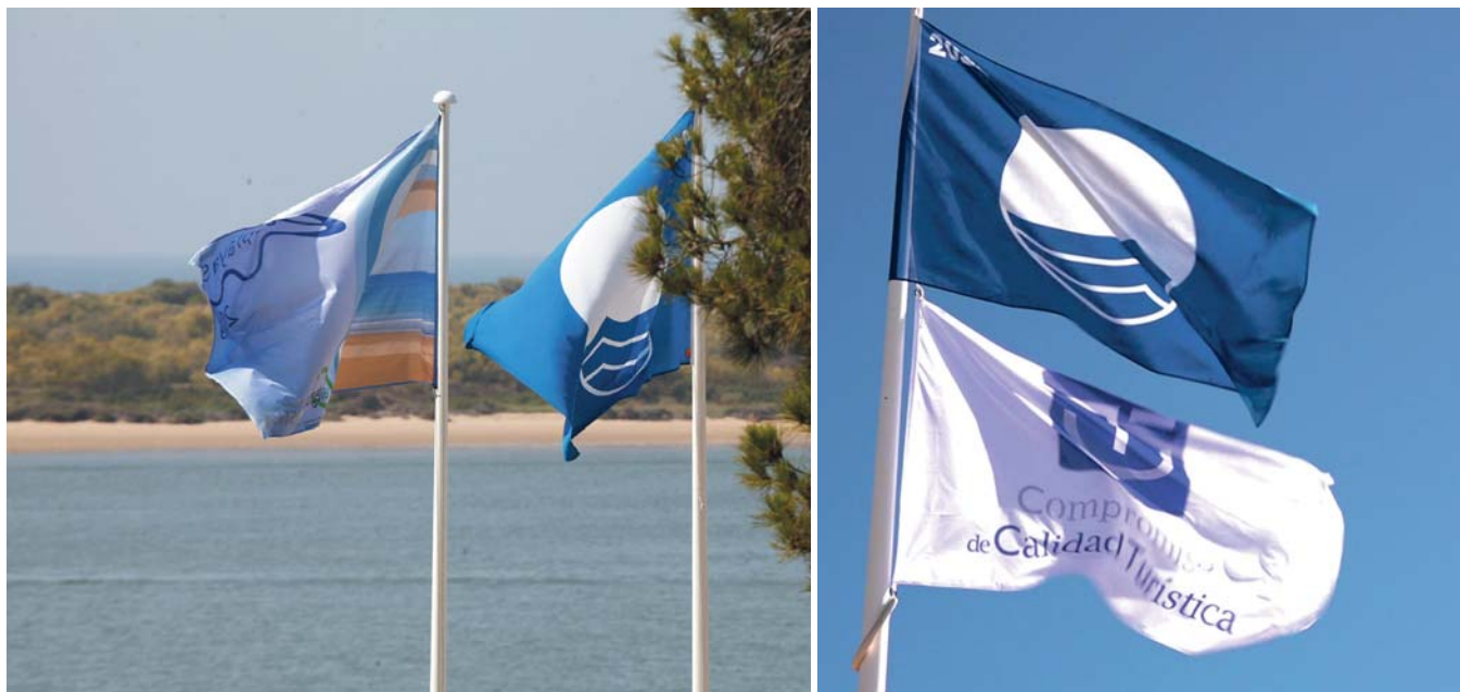
Banderas azules en distintas playas de la Costa Occidental de Huelva.

BALANCE La provincia suma un total de 17 reconocimientos, la mayoría de ellos en Ayamonte e Isla Cristina