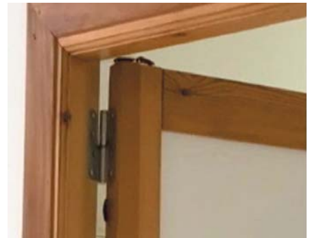
Tres cucarachas en la parte alta de la puerta de la habitación.

La Junta de Andalucía mantiene actualmente un convenio de concertación con dicho hospital, por el que éste recibe anualmente de las arcas públicas un total de cuarenta millones de euros al año.