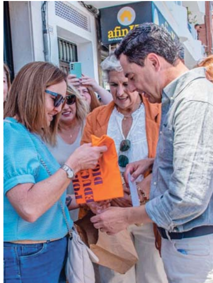
La madre ayamontina aborda a Moreno Bonilla en la calle.

Por todo ello, añaden, “la problemática ha llegado directamente a sus manos” y “ya depende de la Junta poner una solución o mirar hacia otro lado”, por lo que “esperamos tener una respuesta”, pero “una respuesta real”, ya que “no queremos promesas, no queremos verdades a medias y no pedimos favores”, y si “una solución y que doten los coles con lo que por ley les corresponde, necesitamos establecer un ratio