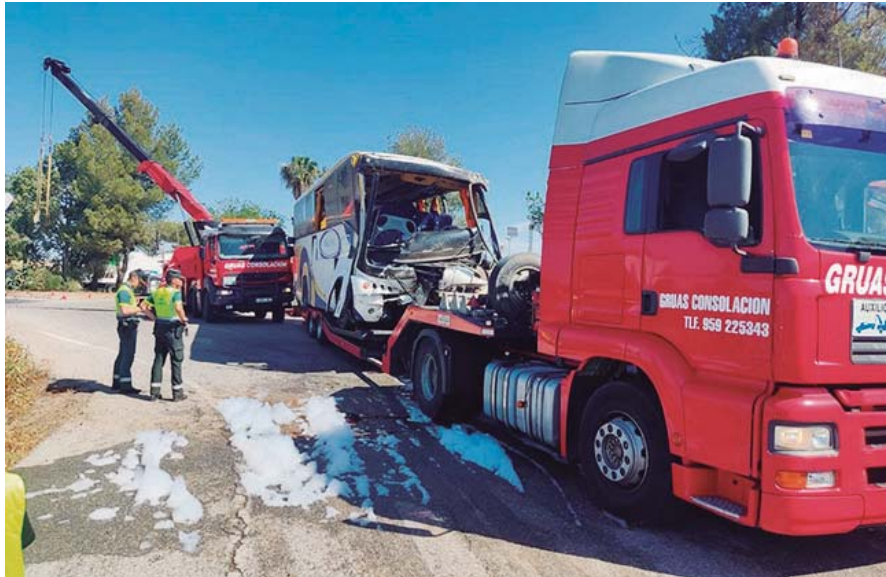
Un camión retira el autobús accidentado.

La regidora explicó que en el autobús siniestrado viajaban temporeras de nacionalidad marroquí que habían subido al vehículo en San Juan del Puerto para desplazarse hasta una finca de Almonte, donde iban a trabajar para una empresa hortofrutícola.