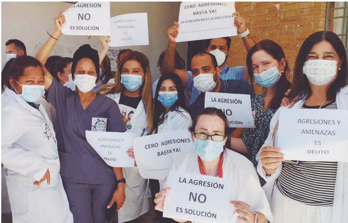
Concentración en Almonte en repulsa a la segunda agresión a un sanitario en menos de un mes. CSIF HUELVA