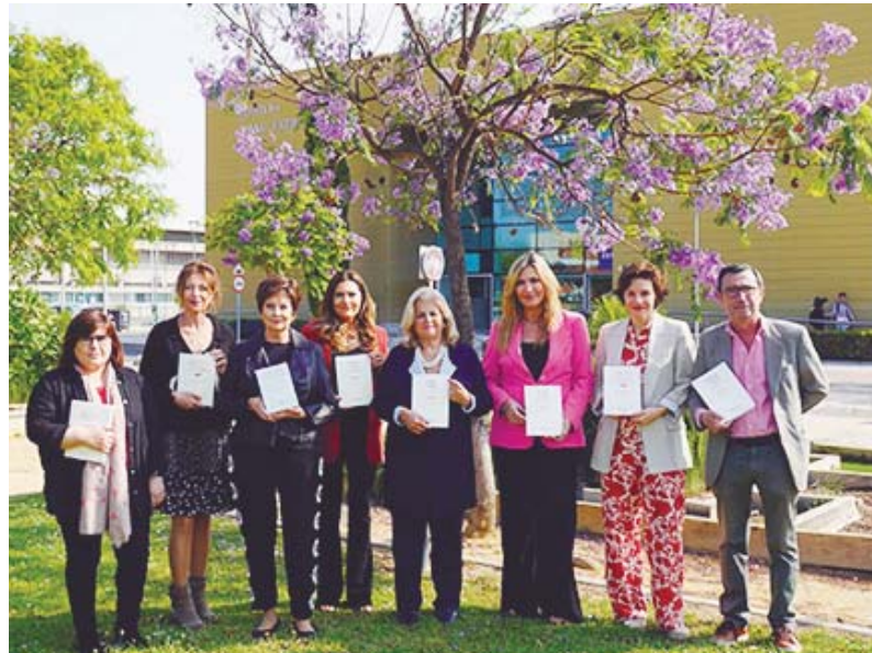
La Cátedra Juan Ramón Jiménez de la UHU presentó las nuevas publicaciones en al Aula al Aire Libre del Campus del Carmen.