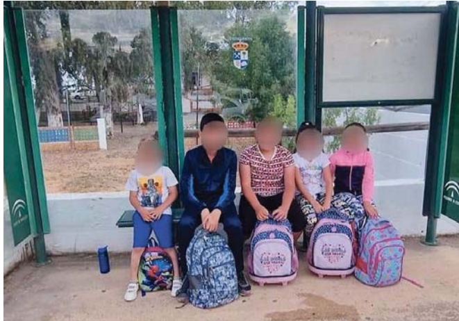
Escolares esperan un autobús que no llegó en una parada de bus.