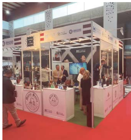
Stand de Diputación de Huelva en Fenavin 2023.

El vicepresidente de Innovación Económica y Social,